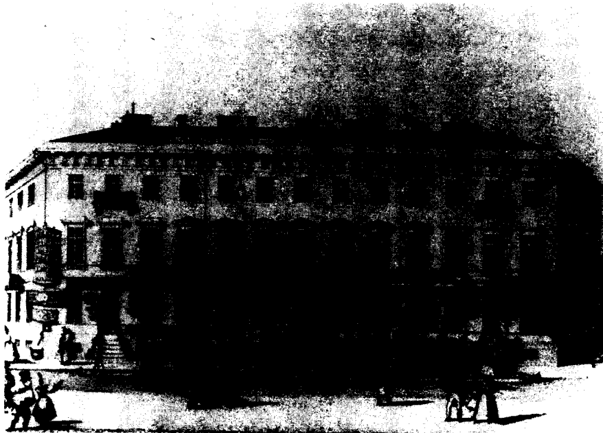
Книжная лавка и библиотека Смирдина. Фрагмент “Панорамы Невского проспекта” В. С. Садовникова. 1830-е гг.

У Расторгуева Невский проспект представлен на всем его протяжении в виде подробнейшей бытовой панорамы (“Рама широка, можно добавить портретов”, – гласит эпитафия к книге). Расставшись со своим постоянным жилищем в городе, автор отправляется в Кронштадт, садится на пароход и плывет на нем “в Петербург, чтобы подобно большей части приезжающих сюда насладиться” ( Прогулки , с. 122) панорамой приближающегося города. Затем он, как и подобает настоящему путешественнику, снимает квартиру на Невском в доме для приезжающих. Но прежде, чем начать прогулку по Невскому, он излагает историю возникновения Петербурга и Невского, подробно останавливается на географии, статистике и климатологии проспекта. Далее он говорит о нравах обитателей проспекта (кого и с какой целью привлекает к себе Невский) и отправляется на прогулку. Он предлагает полюбоваться Невским с башни городской Думы, взглянуть на уличные вывески; описывает уличные типажи и дневную жизнь проспекта, уделяя особое внимание магазинам и торговле в них.