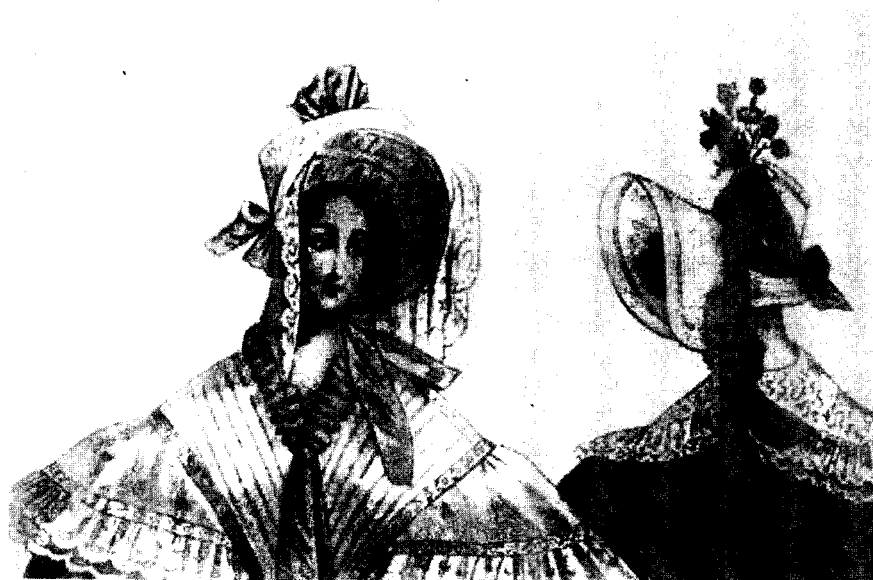
Парижские модницы 1825 г.

Повесть Гоголя “Невский проспект” (1835) открывается панегириком: “Нет ничего лучше Невского проспекта, по крайней мере в Петербурге; для него он составляет всё. Чем не блестит эта улица – красавица нашей столицы! Я знаю, что ни один из бедных и чиновных ее жителей не променяет на все блага Невского проспекта. [...] Невский проспект есть всеобщая коммуникация Петербурга”, а завершается сетованием: “О, не