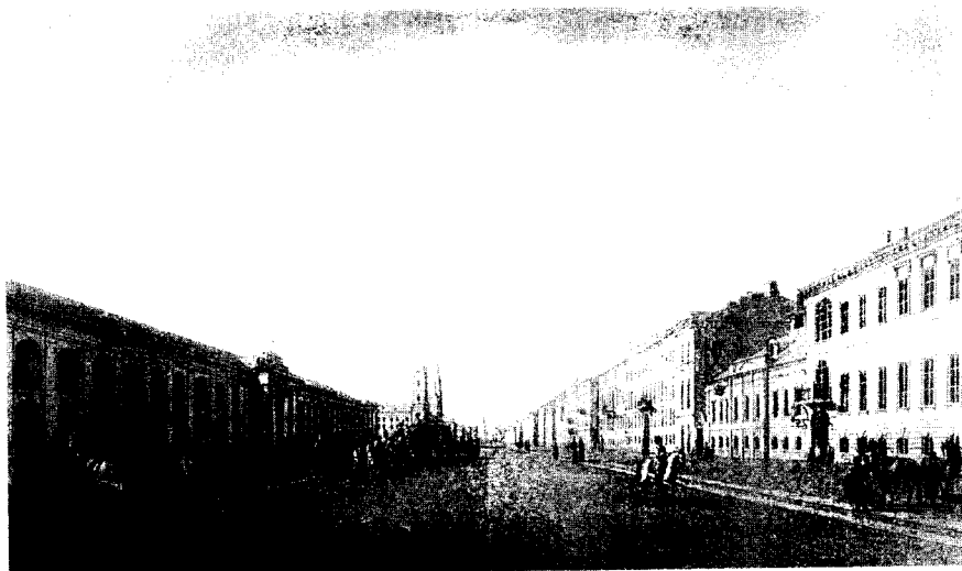
Невский проспект у Гостиного Двора, 1799-1800.